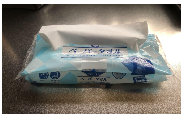
【水回り】使い捨てペーパータオルを使用してください