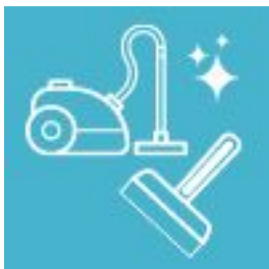
【床】掃除機で吸い取ってください