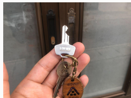
キーボックスの番号は平地域づくり協議 会に確認し、中に入っている鍵を使って 入室してください