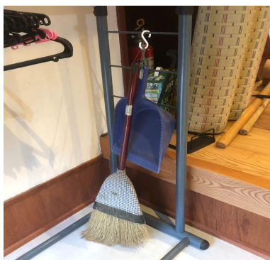
【土間】階段の下に箒と塵取りがあります