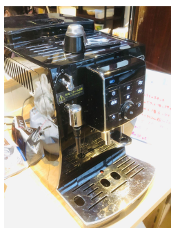
コーヒーマーカー