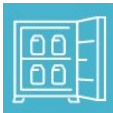
【冷蔵庫】食材は全てお持ち帰りください