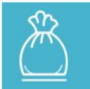
【ゴミ】必ずお持ち帰りください