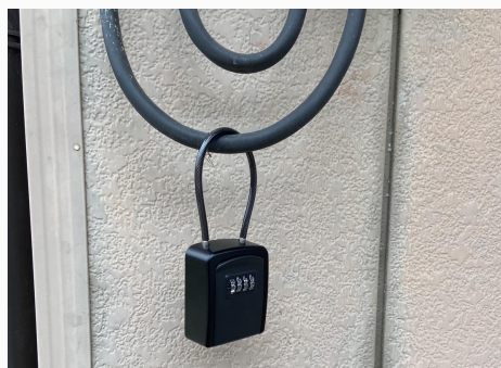
入り口の左手にある電気メーターの下に キーボックスがあります