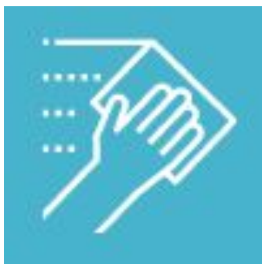
【机】湿らせたペーパータオルで拭いてください