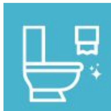
【トイレ】汚した場合は必ず掃除をしてください