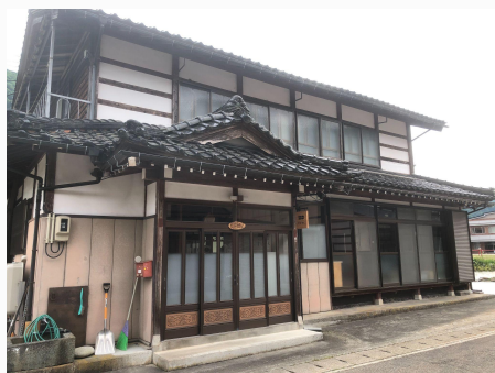
すけろくの外観写真