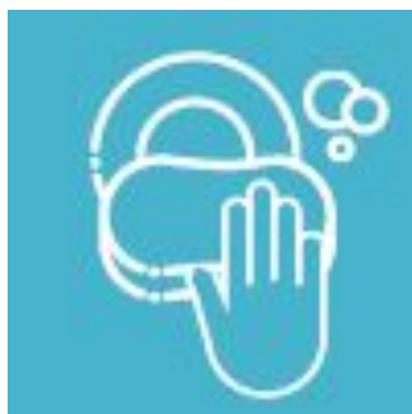
【キッチン】使用した食器は洗浄しペーパータオルで拭いて、元の場所に。シンクの汚れは掃除を