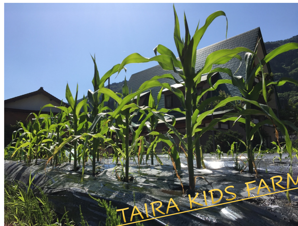
たいら子供農園はじめました！！