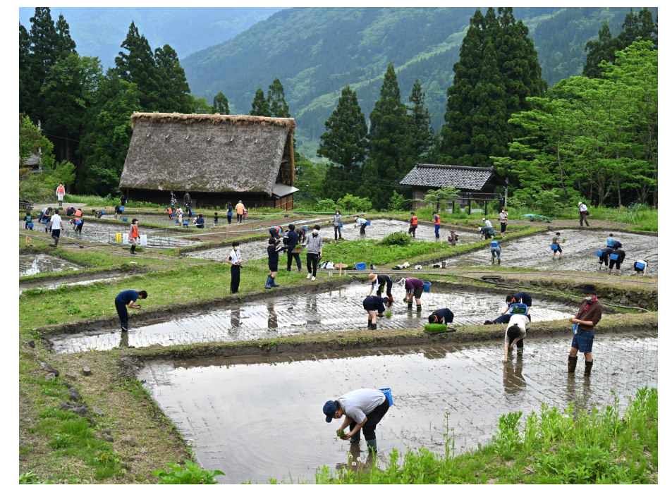
世界遺産で米作り